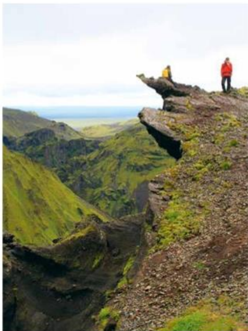
Steeds nieuwe kleuren, een andere wereld

'Honderden foto's, tot mijn vingers zo koud zijn dat ik moet huilen'