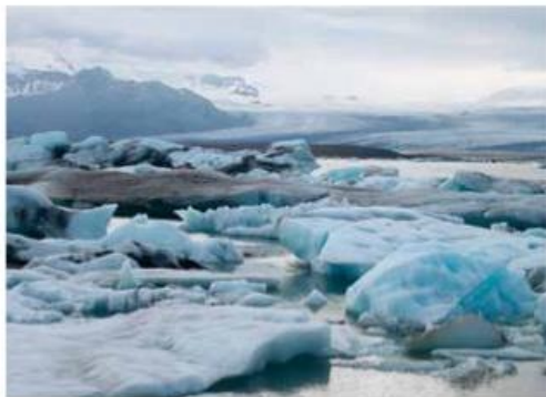
Jökulsárlón, drijvend ijs in magisch blauw

'Honderden foto's, tot mijn vingers zo koud zijn dat ik moet huilen'